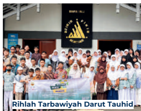
Rihlah Tarbawiyah Darut Tauhid